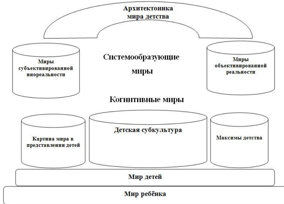
Рисунок 1. Архитектоника мира детства

Согласно Т. Парсонсу, «любая система культурного содержания, особенно ценностная система, должна быть специфицирована, т. е. переведена с соответствующих наиболее общих уровней на уровни, имеющие отношение к весьма частным функциям и потребностям многочисленных и разнообразных подсистем» [Парсонс, 2008: 62]. Следуя этому принципу, в предложенной модели мы выделяем четыре уровня : 1) «мир ребёнка»; 2) «мир детей»; 3) «когнитивные миры», основополагающим для которых является «мир детской субкультуры» (включая связанные с ним «картины мира в представлении детей» и «максимы детства»); 4) «системообразующие миры детства» (включая «миры объективированной реальности» и «миры субъективированной ирреальности»). Основанием для дифференциации в архитектонике данных уровней является их соотнесённость с существующими в научной среде неоднородными представлениями о детстве. Предложенная модель характеризуется универсальностью и позволяет исследовать мир детства в любом временном контексте в рамках определённой национальной культуры, выполняя при этом функцию межнационального эгрегора .