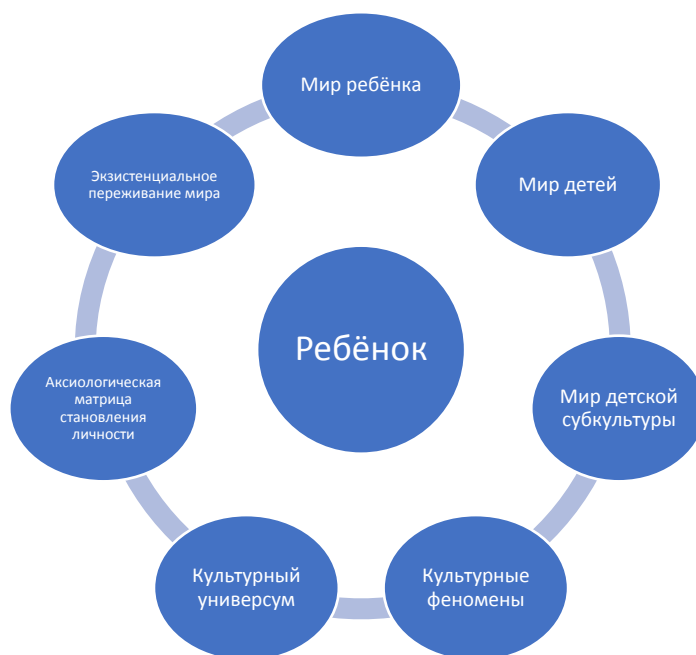
Рисунок 4. Ребёнок как субъект культуры

8. Мир детства как особый феномен культуры является природосообразным этапом культурогенеза каждого очередного поколения, входящего во «взрослую жизнь». Взаимодействие детей с миром строится как двусторонний диалог, в котором фокус внимания постоянно перемещается от персоны ребёнка к миру и обратно. Мир детей – это ментальное пространство, априорно предназначенное для создания смыслов и ценностно-смысловых структур, реализующихся в жизнедеятельности детского сообщества.