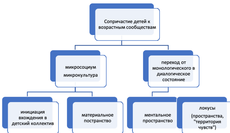
Рисунок 2. Мир детей

Для подтверждения факта существования мира детей, помимо существующих теоретических методов исследования (реализованных в научных работах по теме детства), можно использовать и другие методы: эмпирический (предполагающий включённое наблюдение – нахождение в среде детей и глубокое погружение в их мир) и культурно-контекстуальный (целью которого является анализ исторических контекстов детства) 17 . Все эти методы используются в нашей работе комплексно.