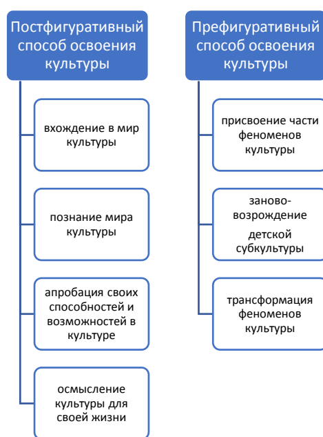
Рисунок 5. Мир детства как этап культурогенеза

8. Мир детства как особый феномен культуры является природосообразным этапом культурогенеза каждого очередного поколения, входящего во «взрослую жизнь». Взаимодействие детей с миром строится как двусторонний диалог, в котором фокус внимания постоянно перемещается от персоны ребёнка к миру и обратно. Мир детей – это ментальное пространство, априорно предназначенное для создания смыслов и ценностно-смысловых структур, реализующихся в жизнедеятельности детского сообщества.