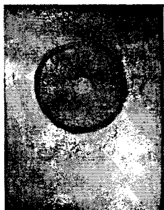
Верхние слои Шаданакара. Точка сингулярности

Точка сингулярности – это схождение смыслов, неразличимость, граница между бытием и небытием, между небытием бытия и бытием небытия. Каждый человек представляет собой точку сингулярности, ибо в определенный момент времени происходит «большой антропологический взрыв». Из одной клетки за короткий срок в процессе онтогенеза возникает 300 трлн клеток человеческого организма. Концепт человеческого бытия прячется не в теле человека и не в биосфере Земли – он имеет вселенское измерение. (Нетронутый краской цвет картона – так называемая «темная материя».)