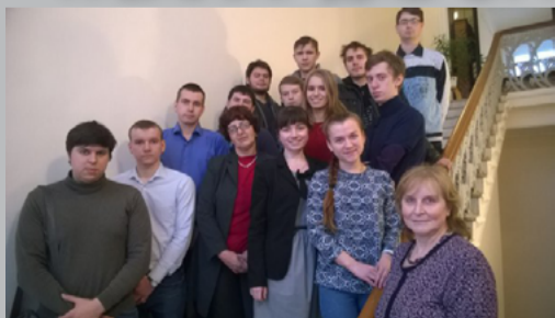
Первый набор магистрантов направления «Социальное государство: проблемы теории и юридической практики» (1 курс очного отделения) вместе с преподавателем и сотрудницей музея.