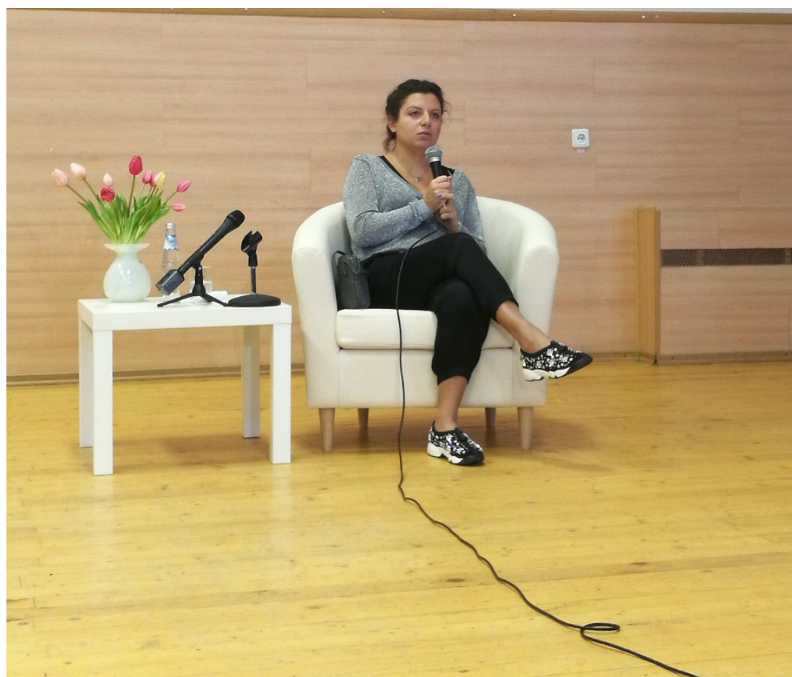
лекция от Маргариты Симоньян, главного редактора RT

Посещать регулярно организуемые лекции от известных политологов, дипломатов, специалистов в сфере МО