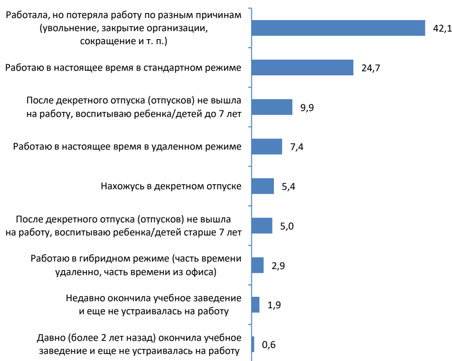
Рис. 1. Ситуация относительно занятости (статус занятости), %

Для целей исследования нам было важно знать статус занятости каждой из опрошенных женщин. Мы использовали отличающуюся от стандартной градацию статусов занятости (рис. 1).