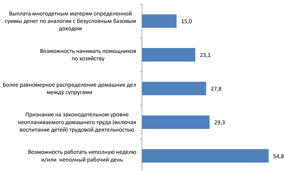
Рис. 3. Изменения, которые помогли бы более эффективно сочетать профессиональную деятельность и воспитание детей, %

В рамках нашего опроса мы хотели узнать мнение респондентов относительно возможных изменений, которые помогли бы женщинам более эффективно сочетать работу и воспитание детей (рис. 3).