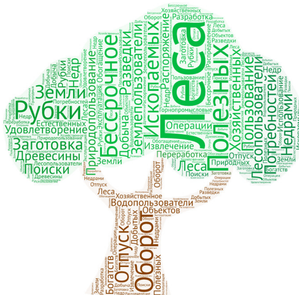
Рис. 1. «Язык» природоресурсного права

пользователи» и т. д.; «удовлетворение хозяйственных потребностей», «оборот рубки леса», «заготовка леса», «отпуск древесины», «пользование и распоряжение недрами земли», «поиски, разведки, добыча, извлечение, обогащение и переработка полезных ископаемых», «распределение добытых полезных ископаемых», «эксплуатация недр», «горнопромысловые операции», «разработка естественных богатств», «хозяйственное использование природных объектов» и другие (Рис. 1).