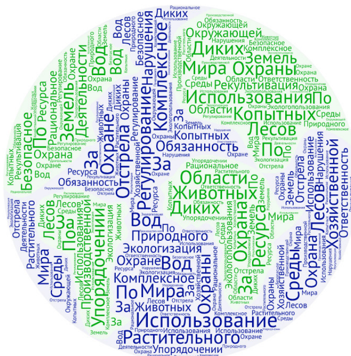
Рис. 2. «Язык» природоохранного права

Массив кодификационного природоохранного законодательства сложился в основном в период с 1970 по 1982 год. Он включал такие акты, как Земельный кодекс РСФСР (1970), Водный кодекс РСФСР (1972), Кодекс РСФСР о недрах (1976), Лесной кодекс РСФСР (1978), Закон РСФСР об охране атмосферного воздуха (1982), Закон РСФСР об охране и использовании животного мира (1982). Эти законы были приняты в соответствии с Основами земельного, водного, лесного и горного законодательства Союза ССР и союзных республик, Законами СССР об охране атмосферного воздуха и об охране и использовании животного мира.