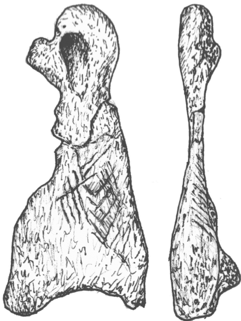
.2. IIA. ( ) ( . . )