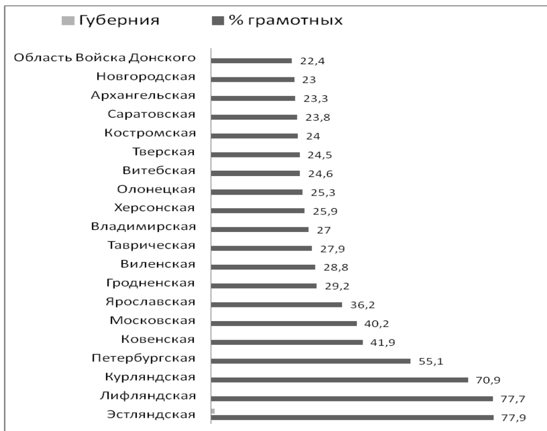
Грамотность населения Европейской России в 1897 г.*

Однако важен не только рост уровня грамотности крестьянства, но и постепенное, пусть и медленное, изменение отношения к книге в этой среде. Опросы сельских жителей в конце XIX в. подтверждали, что грамотные крестьяне относятся к чтению с любовью и охотой. В особом почете у них книги религиозного содержания. «За их покупку даже безграмотные бабы не ругают», — говорили земские статистики [2, с. 165]. При этом отношение селян к книгам было своеобразное — всё прочитанное в них они считали непреложной истиной.