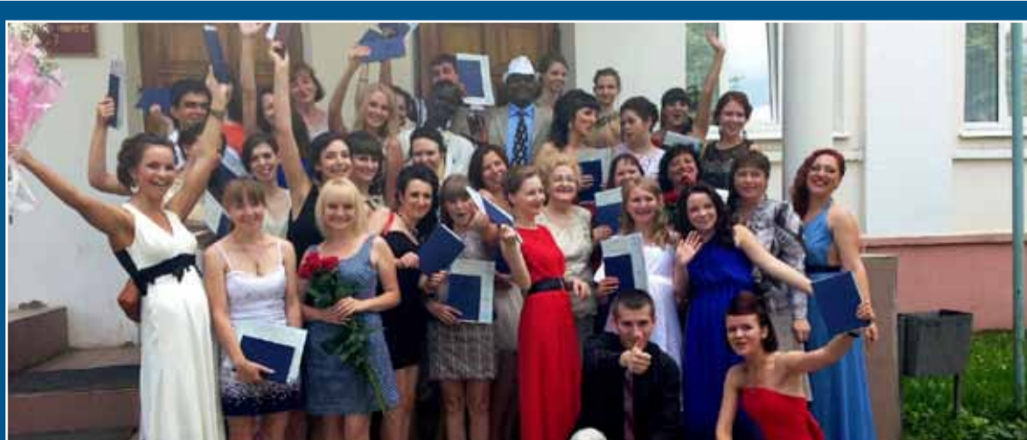
Выпускники социолого-психологического факультета