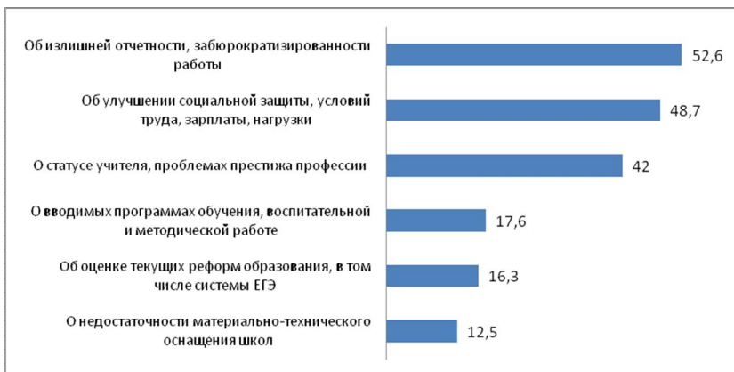
Рис. 1. Содержание письма Министру образования и науки РФ, % вопрос множественный (N = 200)

Достаточно интересные результаты были получены на вопрос «Если бы Вы могли написать письмо министру образования, которое он обязательно прочел бы, то о чем было бы это письмо?». Значительная часть «писем» посвящены «улучшению социальной защиты»: повышению заработной платы, снижению трудовой нагрузки, улучшению условий труда. Независимо от типа учреждения, учителей волнует вопрос «об излишней отчетности, забюрократизированности работы» и «о статусе учителя, проблемах престижа профессии» (рис. 1).